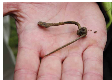
Een Romeinse mantelspeld.

Het is overigens opmerkelijk dat de Romeinse bewoners in Schiedam over relatief luxe gebruiksgoederen beschikten, de Romeinse grens lag immers bij de Rijn. In de grond hebben archeologen niet alleen de constructie van een boerderij gevonden maar ook voorwerpen uit de 2e eeuw. Het gaat om Romeins serviesgoed, verschillende mantelspelden, munten, stukjes sierbeslag van paardentuig en aardewerk.