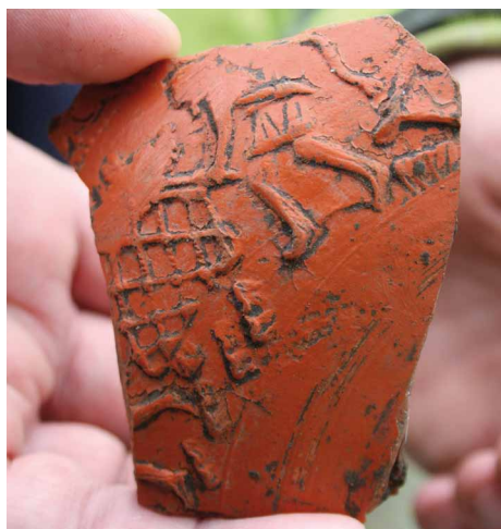
Een scherf van Romeins serviesgoed met een jachtscene erop.

Archeoloog en adviseur Sander Hakvoort is verheugd over de vondst in het Hargapark. “De laatste keer dat we een dergelijke goed geconserveerde boerderij uit die tijd hebben gevonden is alweer ruim dertig jaar geleden.